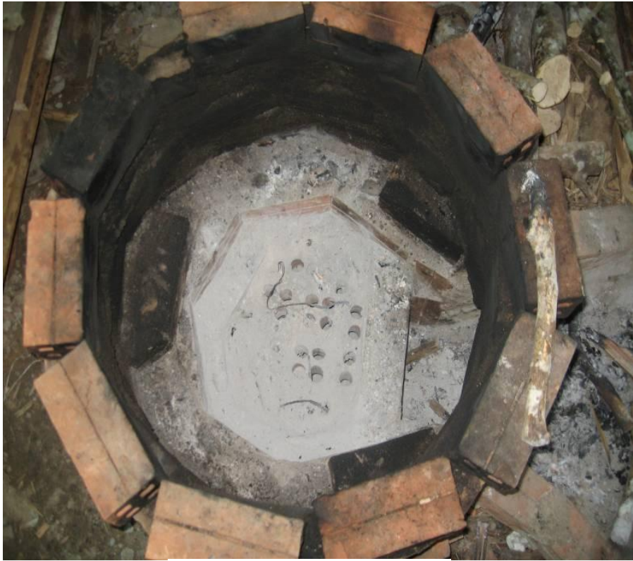
រូបចង្ក្រានចំហុយ