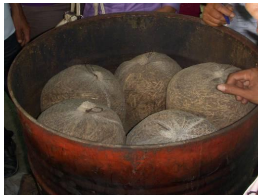
រូបសញ្ញាដុំកំប៉ុស្តិ៍ក្នុងធុងចំហុយ