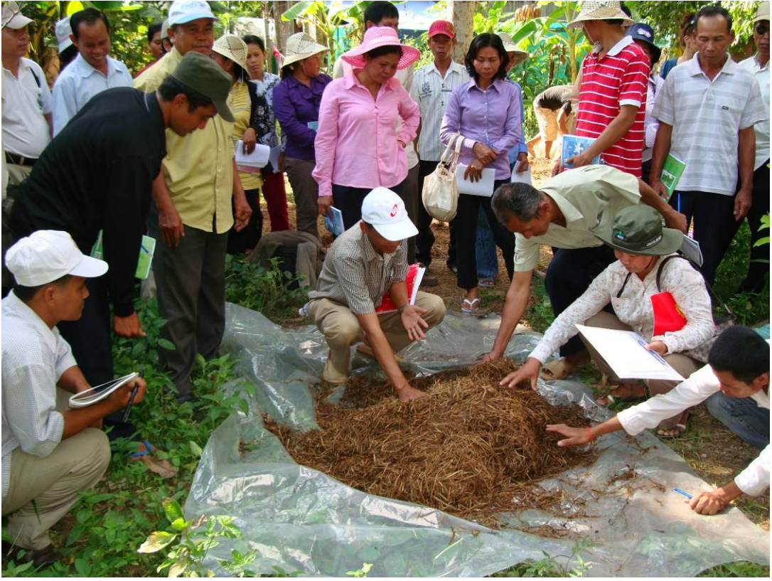
កំប៉ុស្តិ៍ដែលកាច់ល្អ នៅពេលយើងសង្កត់វា យើងមានអារម្មណ៍ថាត្រជាក់ ប៉ុន្តែមិនសើមដៃ