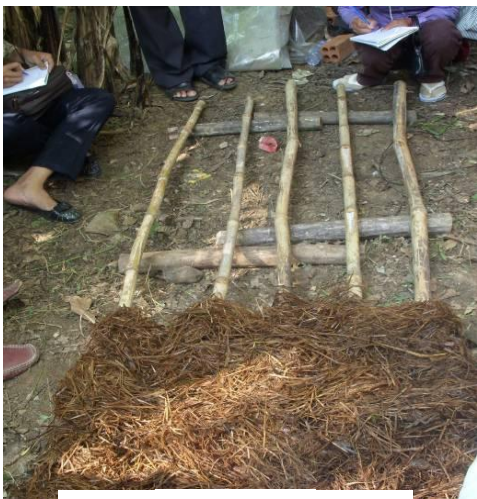
ធ្វើពិន្ទុកកំប៉ុស្តិ៍