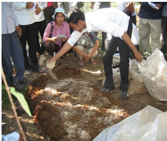
ការធ្វើពិន្ទុកកំប៉ុស្តិ៍